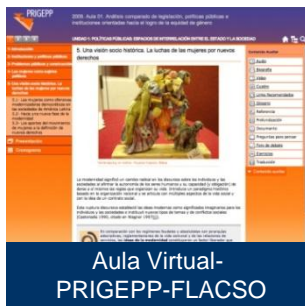
Aula Virtual- PRIGEPP-FLACSO